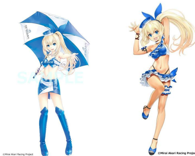
<KEI 氏による描き下ろしイラストと新規描き下ろしイラスト>