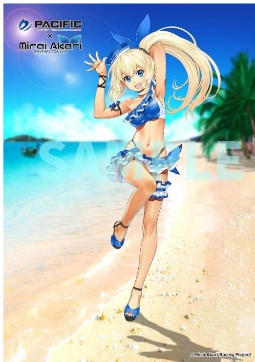
<ミライアカリ レースクイーン タイ Ver.描き下ろしイラストのキービジュアル>

そしてこの度、Rd.4 タイランドの参戦記念としてミライアカリ レースクイーン タイ Ver.の新規描き下ろしイラスト（本イラスト）を公開した。