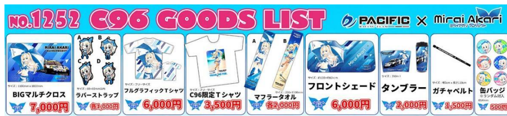
<コミックマーケット 96 新規販売グッズ一覧>

本イラストが使用されるコミックマーケット 96（C96）で販売されるグッズ情報が公開された。C96 ではミライアカリのキャラクターデザインを担当したイラストレーター『KEI』氏による描き下ろしイラストが使われたグッズが並んでいる。このイラストを使用したグッズのイベント販売は今回が初となり、大きな話題を呼んでいる。加えて新たに公開した本イラストを使用したグッズも販売され、『パシフィックレーシングチーム』ブースはファンからの垂涎的となるだろう。